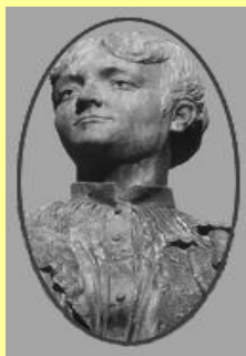
Maria DERAISMES (1828-1894) Première femme initiée en Franc-Maçonnerie dès 1882

La Commission proposera des textes sur ces sujets permettant une information aussi exhaustive que possible sur l'état des connaissances, en dégageant les enjeux en termes biologiques, économiques sociologiques et philosophiques, ainsi que les avancées et les risques avec une lecture propre à nos valeurs.