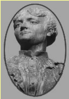
Maria DERAISMES (1828-1894) Première femme initiée en Franc-Maçonnerie dès 1882

Le Droit Humain travaille à la construction d'une société libre et fraternellement unie dans laquelle les femmes et les hommes, à égalité , trouvent le plus de développement matériel et moral possible.