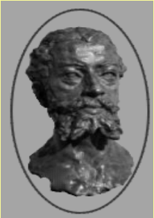
Georges MARTIN (1844-1916) Fondateur avec Maria DERAISMES du 1 er Ordre Maçonnique Mixte en 1893

LIBERTE LAÏCITE EGALITE JUSTICE SOCIALE FRATERNITE TOLERANCE